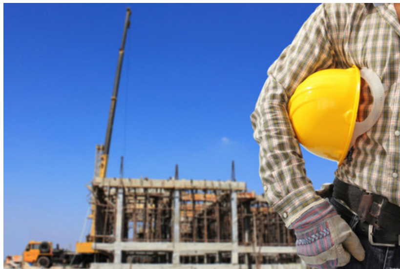
"Il futuro è nelle tue mani": Ance invita i giovani a cercare lavoro nel mondo delle costruzioni